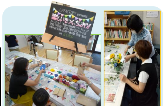
《にこまち助成金を活用した活動をご紹介します》

※新規事業の場合や6年目以降の申請の場合は、審査委員会でのヒアリングが原則必要となります。