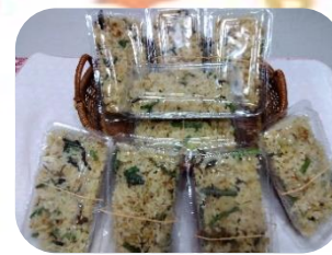
* 山菜ごはん *

みんなの食堂が末永く続けられますよう皆様からの募金とお米のご寄贈を宜しくお願い致します。