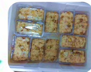
* 栗ごはん *