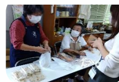
* 販売しました *