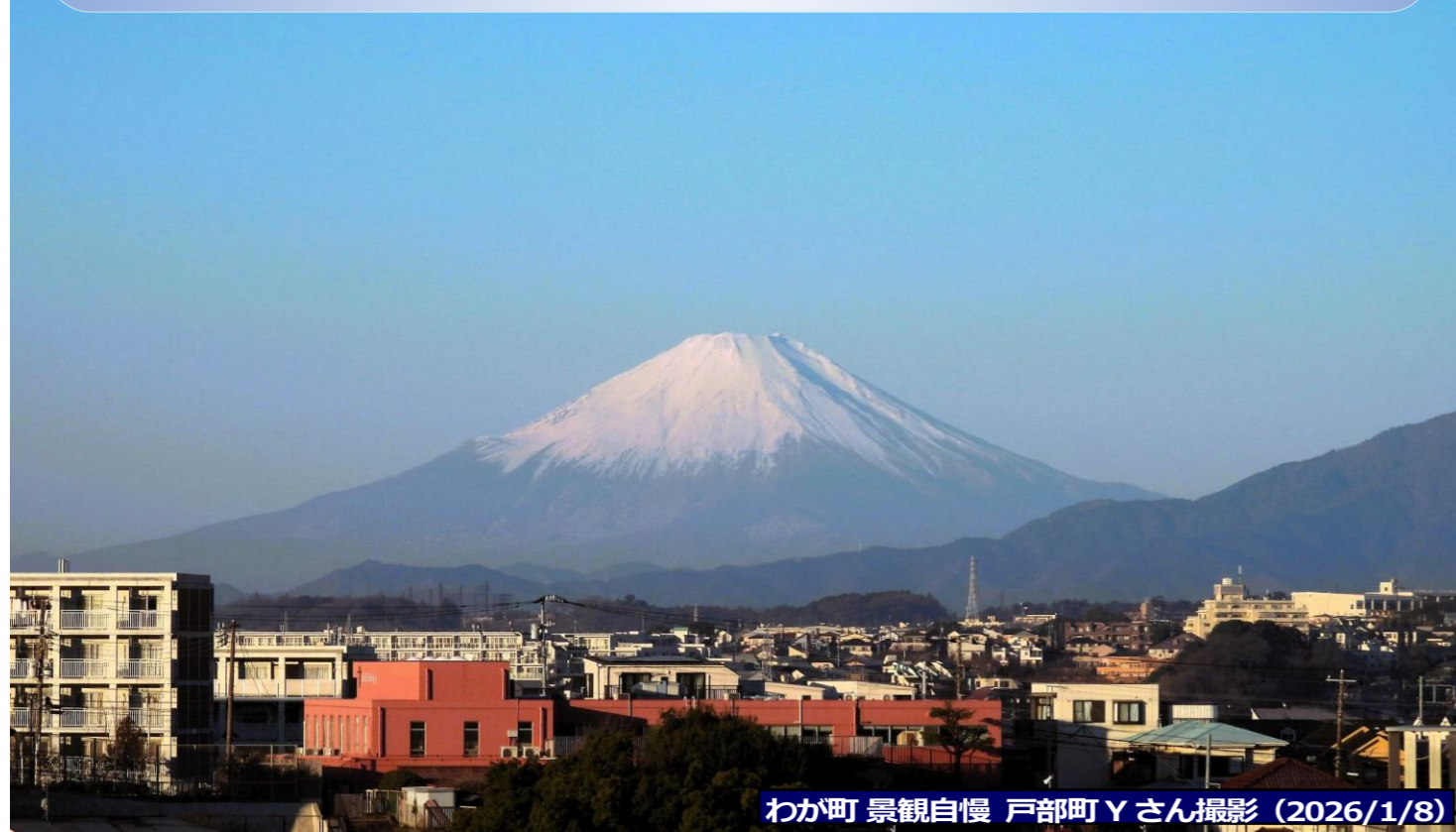
わが町 景観自慢 (2026/1/8)