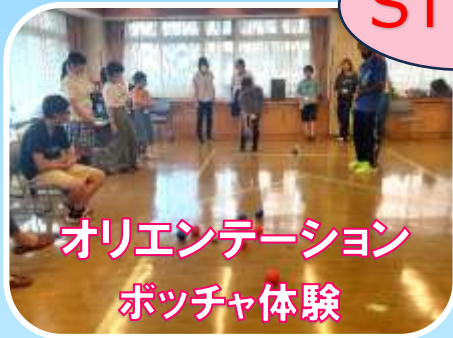
オリエンテーション ボッチャ体験