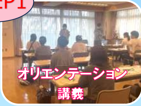
オリエンテーション 講義