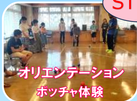
オリエンテーション ボッチャ体験