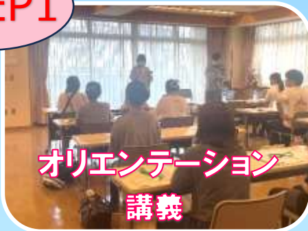
オリエンテーション 講義